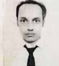
انس میاں (57 77 نمبر) تیسری پوزیشن

Principal R.A. & U.T.M.C.H.R.C. Bhawanigarh-148026 (Sangrur)